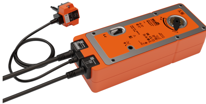
Zdjęcie może odbiegać od rzeczywistego wyglądu produktu