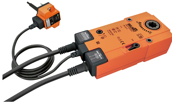
Zdjęcie może odbiegać od rzeczywistego wyglądu produktu